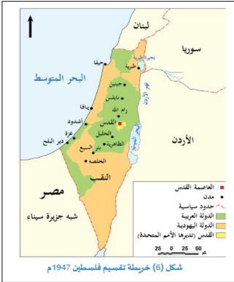
شكل (6) خريطة تقسيم فلسطين 1947م